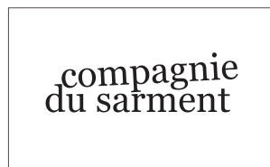
compagnie du sarment

Aportant plenament l'experiència de cada disciplina i deixant que cada matèria influencii l'altra, volem, amb aquest treball, crear un nou terreny de recerca basat en l'aprenentatge mutu.